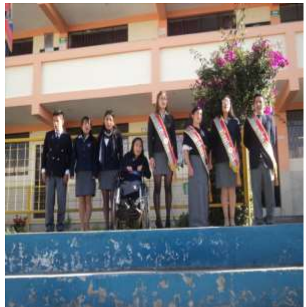
ESTUDIANTE CON DISCAPACIDAD