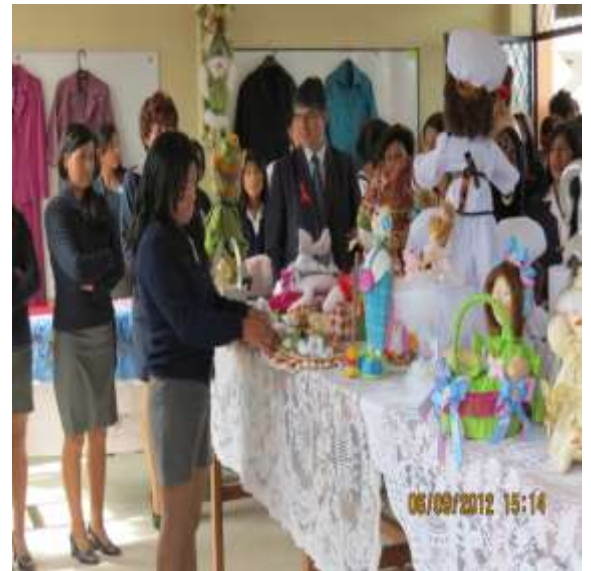
INDUSTRIA DE LA CONFECCIÓN