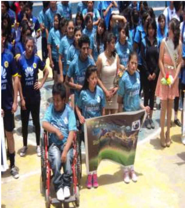
ESTUDIANTE CON DISCAPACIDAD