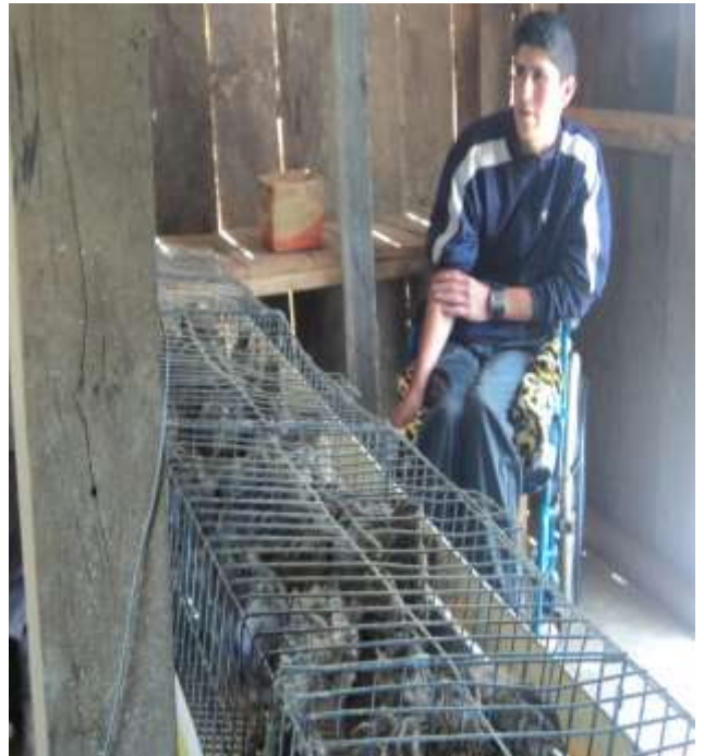
ESTUDIANTE CON DISCAPACIDAD