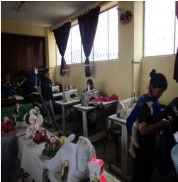
INDUSTRIA DE LA CONFECCIÓN