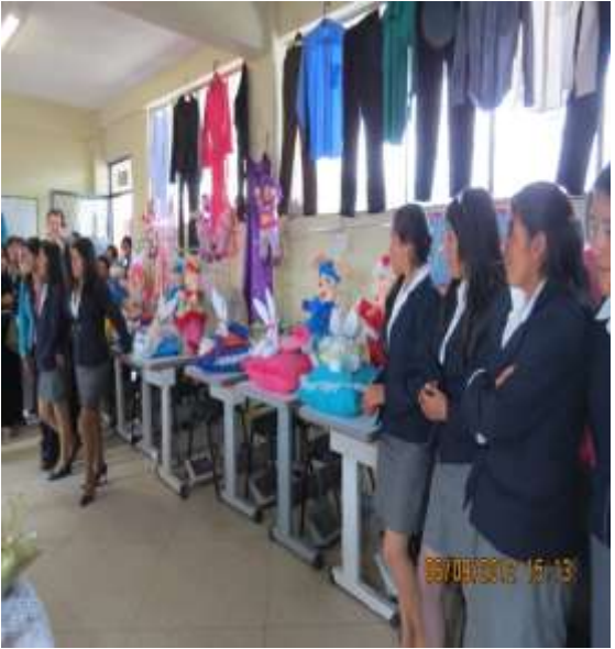
INDUSTRIA DE LA CONFECCIÓN