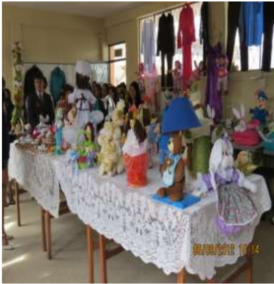
INDUSTRIA DE LA CONFECCIÓN