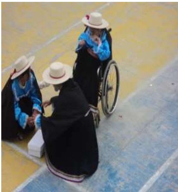
ESTUDIANTE CON DISCAPACIDAD